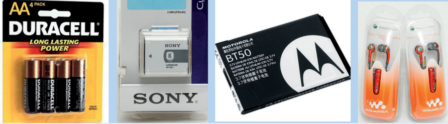
Contrefaçons de marques de produits électroniques (Duracell, Motorola, Sony, Sony Ericsson)

L'une des priorités de l'Administration des douanes mexicaines est de contribuer au renforcement de la sécurité nationale en luttant contre les organisations criminelles. Ce projet répond à un objectif majeur du plan de développement national pour la période 2007-2012, à savoir paralyser les revenus illicites de ces organisations.