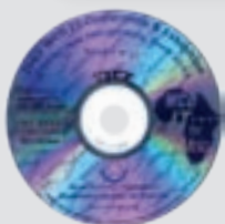
Réf: 301 Johannesburg

Pour commander, contactez le Service Publications de l'OMD Courriel: publications@wcoomd.org - Fax: +32(0)2 209 94 90