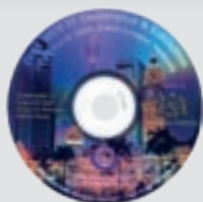
Réf: 401 Kuala Lumpur