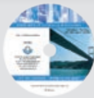
Réf: 501 Istanbul