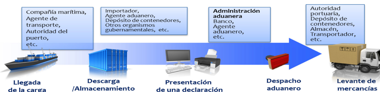
Gráfico 2: Ejemplo de ETNL

Otros ejemplos de herramientas de la OMA diseñadas para apoyar el trabajo de los CNFC incluyen: