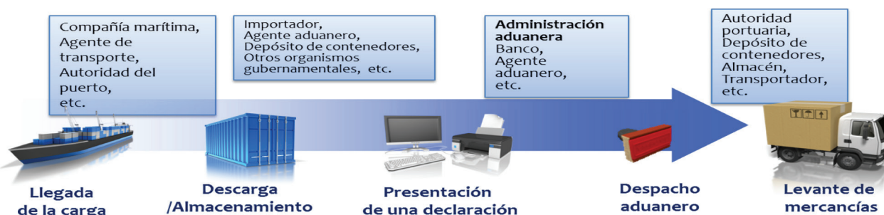
Gráfico 2: Ejemplo de ETNL

Otros ejemplos de herramientas de la OMA diseñadas para apoyar el trabajo de los CNFC: