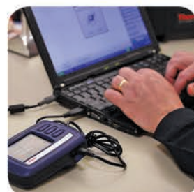
Results easily downloaded for reporting and evidence.