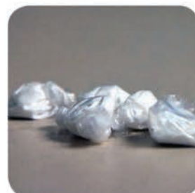
Test a sample for multiple narcotics in a single analysis.

• learn more at thermoscientific.com/trunarc