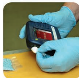
Analyze through sealed packaging for most samples.