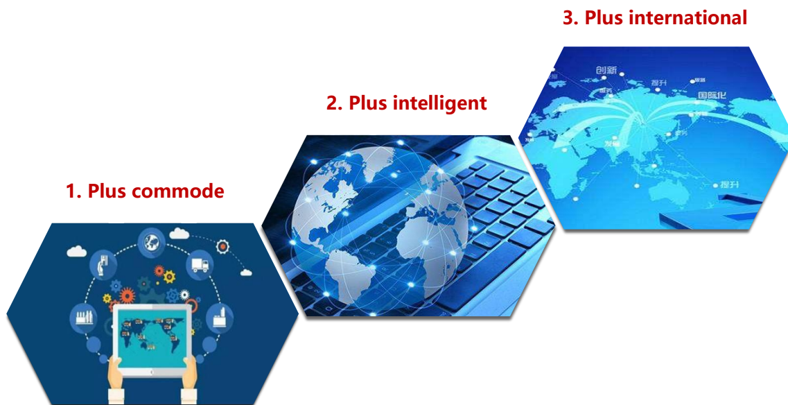
Illustration 4 - Les étapes à venir du GU chinois